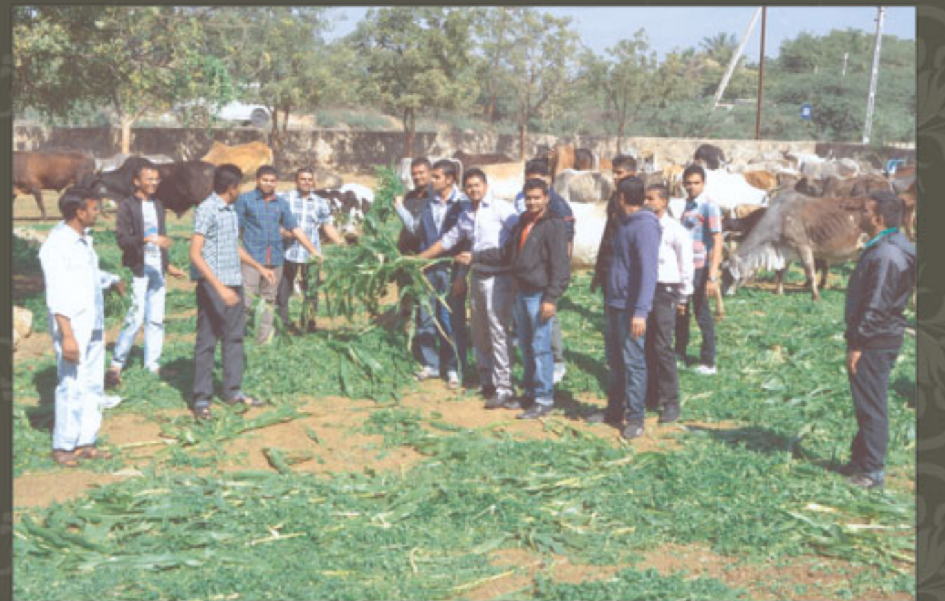
માનકુવા ભકિતનગર મંદિરમાં સમૂહ વચનામૃત પારાયણ તથા ગાયોના ચારાનું વિતરણ